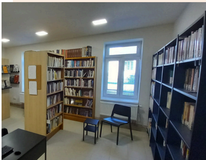
NOVÉ PROSTORY KNIHOVNY V HORNÍCH DUBENKÁCH