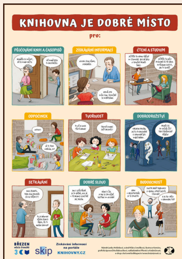
PLAKÁT K MĚSÍCI ČTENÁŘŮ

25. 11. 2025 ve 13:00 - Vánoční tvoření pro neprofesionální knihovníky